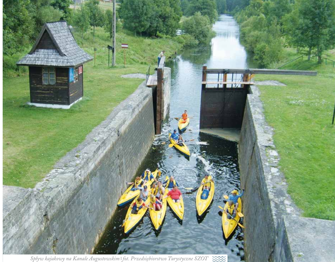
Spytew kajakowy na Kanale Augustowskim

Konferencja ma na celu wskazanie konieczności kontynuacji zadań w kierunku rozwoju i promocji produktu turystycznego